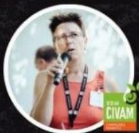
INÈS DE RANCOURT

Porte-Parole de la Confédération paysanne