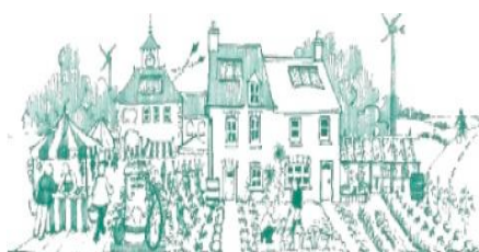
Pays d'Aix en Transition