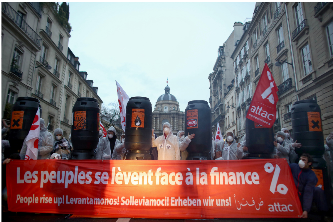
Action d'Attac France contre la finance toxique devant le Sénat le 19 mars 2013